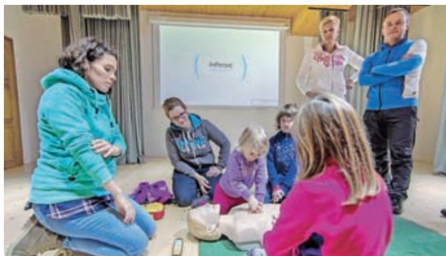
S tečaja o temeljnih postopkih oživljanja