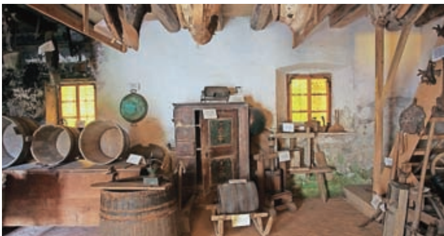
Motiv iz Jenkove kasarne