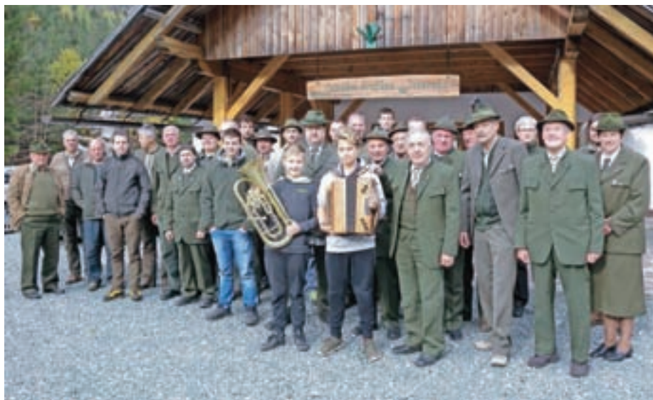
Ob šestdesetletnici »nove« LD Jezersko pred lovskim domom

V obdobju 60. let so jezerski lovci postavili macesnov gamsov bivak v strminah Vadin, jezerskih Ledin. V 70. letih je na Staniču v Komatevri LD zgradila lovsko kočjo, ki je v centru lovišča tudi za lov na srnjad, gamsa pa tudi medveda, ki rad zaide na to območje. V začetku je LD domovala na Makekovem, pri starešini, pozneje so v hotelu Kazina dobili v najem prostor, ki so ga uredili kot slikovito lovsko sobo odprtega značaja. Z zaprtjem Kazine v 90. letih so prostor izgubili, dobili so ga v kmetijski zadrugi Sloga. Želja članov in lokalne skupnosti pa je bila, da bi kot edina LD v Sloveniji, ki je še brez lastnega lovskega stanovskega doma, končno prišla do lastnih prostorov. Vsem je bilo v veselje, ko so od posestnikov Jenkovich in Koprivnikovih v dolini Ravenske Kočne pod Turni kupili zemljišče. Ker občina še ni imela prostorskega načrta, so najprej lahko na to posest po-