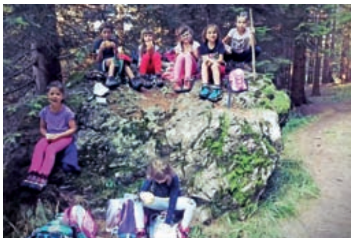
Celoletna šola športa poleti spodbuja tudi pohodništvo.