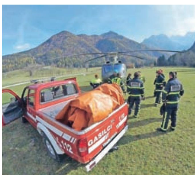
Z vaje Gozdni požar Jezersko 2017

jezero; ekipe polnijo bazen za helikoptersko gašenje in pomagajo pri zajemu vode;