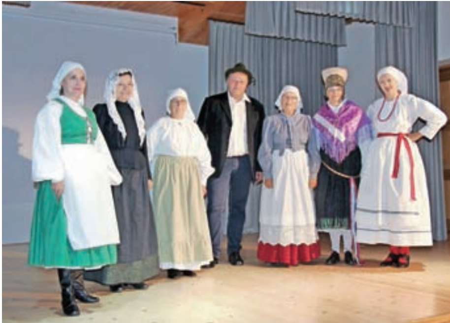
Pripovedovalci iz različnih slovenskih pokrajin

Vsem občanom in občankam občine Jezersko želimo srečne in vesele praznike.