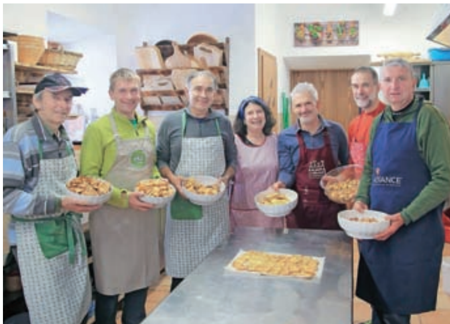
Udeleženci kuharskega tečaja