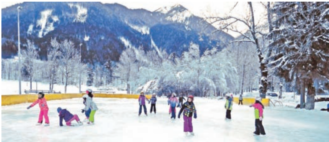
Dobro razpoloženi na ledeni ploskvi